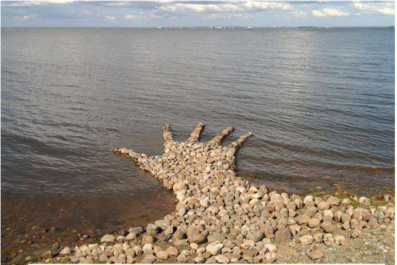
Tanya Preminger, "Kronstadd", 2014, granite, 580 x 350 x 50 cm, "Kronfest", International Ecological Festival, Kronstadd, Russia.