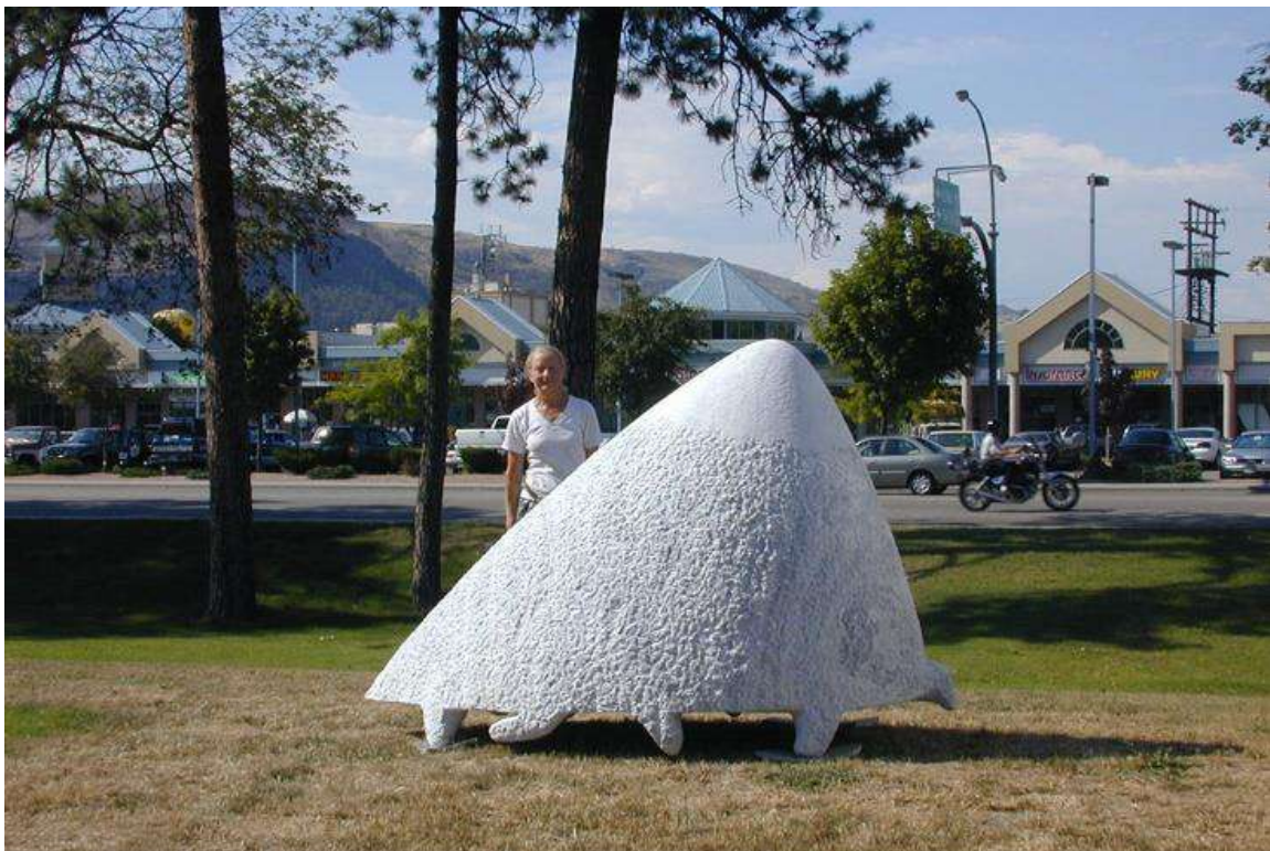
Tanya Preminger "The mountain is coming to Mohamed". 2002. Marble. 160 x 250 x 110 cm. Vernon, Canada.