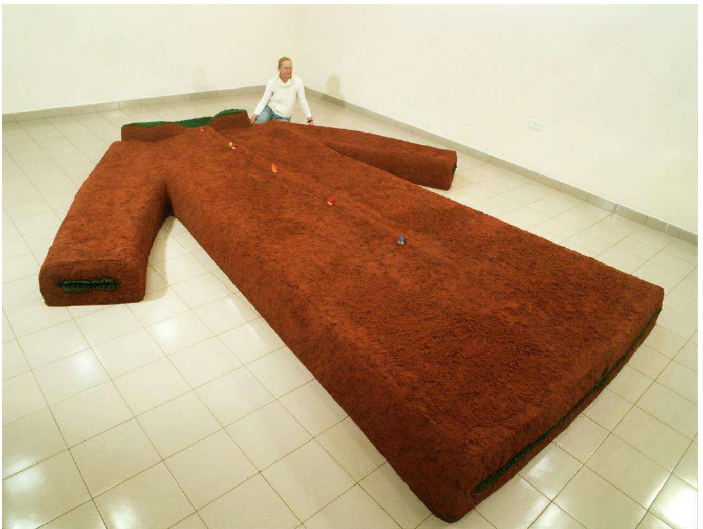
Tanya Preminger , "Landscape of Motherland". 2006. Installation. Soil, calcar, synthetic grass. 35 x 500 35 x 35 500 x 400 x 35 x cm. Hulon, Israel.

התערוכה הוצגה בשתי הקומות של המשכן לאמנות בית מאירוב. בקומה התחתונה, על כל אורך האולם הגדול הוצב הפסל "נוף מולדת" מאדמת חמרה. בשלושת האולמות האחרים של הגלריה הוצגו למעלה מעשרים פסלים, רישומים ומיצבים החושפים את השקפתה של האמנית - לעיתים בלתי צפויה, לא סטנדרטית – על תפקיד האישה בעולם, אימהות ונשיות.