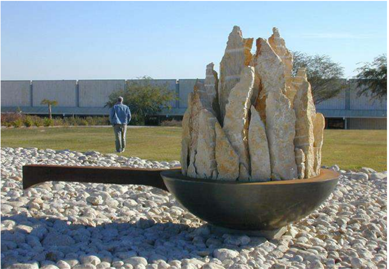
"Saucepan", 2004 Stone, concrete, iron, 280 x 450 x 240 cm, Arsuf, Israel

בשטחי החוץ של המוזיאון טניה הציגה 22 פסלים גדולים מאבן. העבודה "מרחשת" שנעשתה עבור התערוכה, נמכרה בהמשך לעיריית חדרה. העבודה היא מטפורה לאדמה הבוערת של ארץ הקודש.