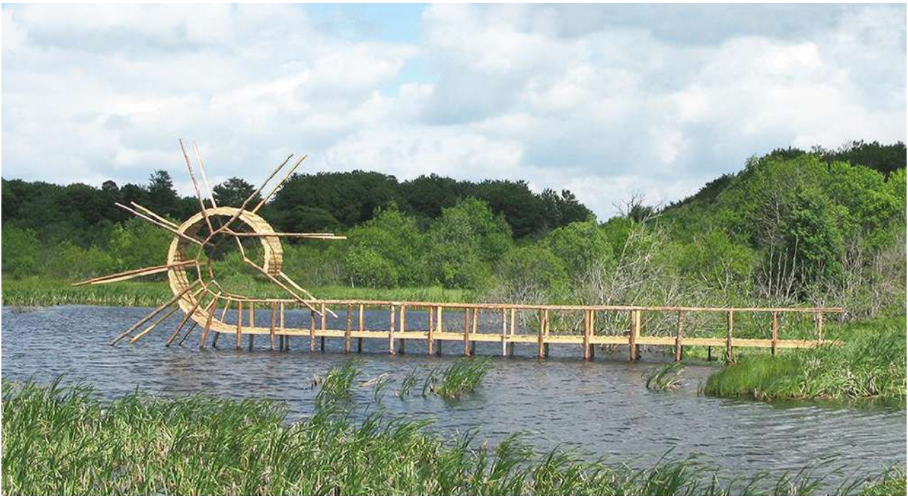
Tanya Preminger "Back Flip Bridge". 2009, Wood. 550 X 1850 X 80 cm. Environmental Art festival "Horizons Renconter Arts Nature" in Massif du Sancy, France.

העבודה "גשר בפליק פלאק" הוצגה בשער מדור האמנות של עיתון "לה מונד" בסקירה על התערוכה.