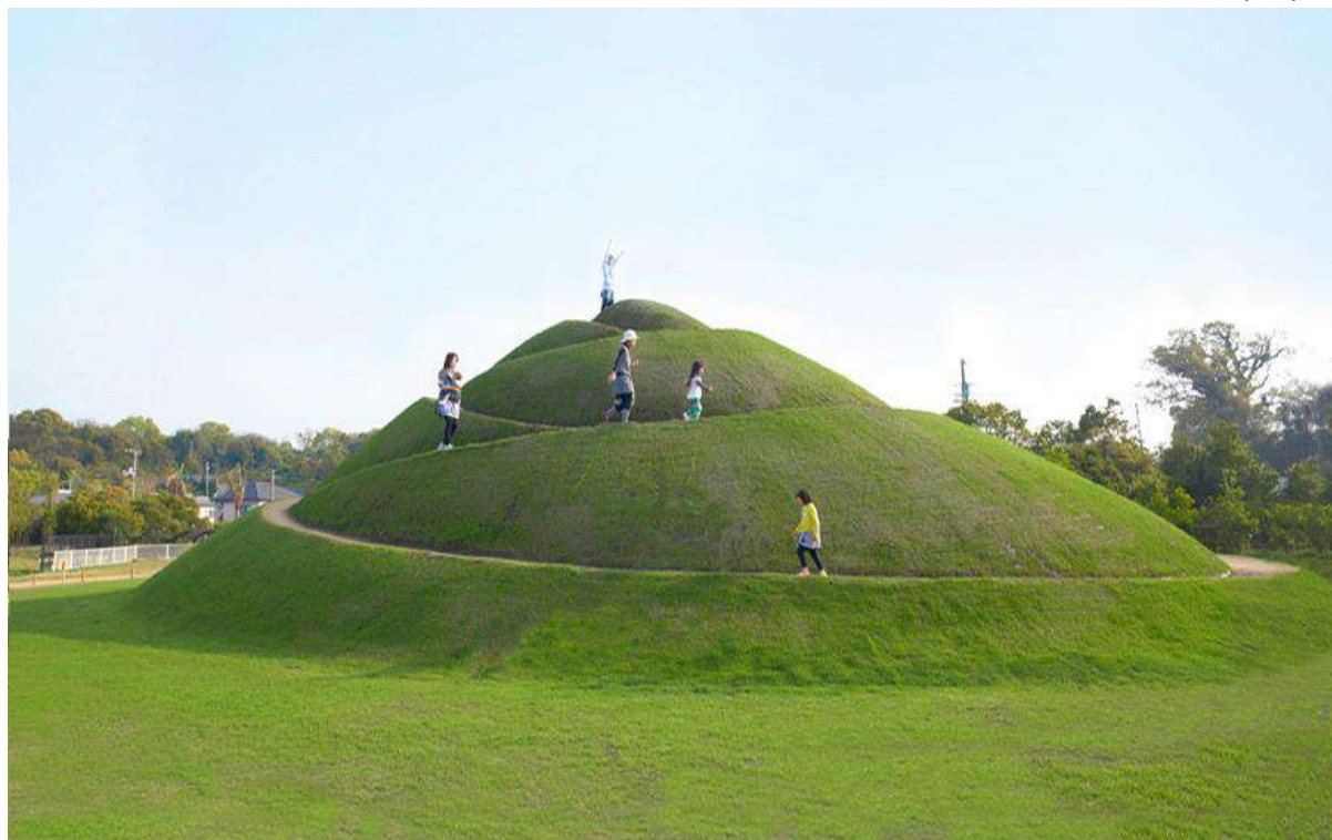
Tanya Preminger, "Stratum", 2013, earth, grass, 650 x 2800 x 1800 cm, Shamijima, Setuchi Triennale Japan.

התערוכה מתקיימת כל 3 שנים והעבודות ממוקמות למשך 3 שנים במקומות שונים באיים של הים הפנימי היפני. שם הפרוייקט "סטרטום" (שכבות). בגלל אהבת הקהל המארגנים השאירו את הפרוייקט לטריאנלה הבאה. הפרוייקט קיבל גרנט מ-A.R.T.I.S.