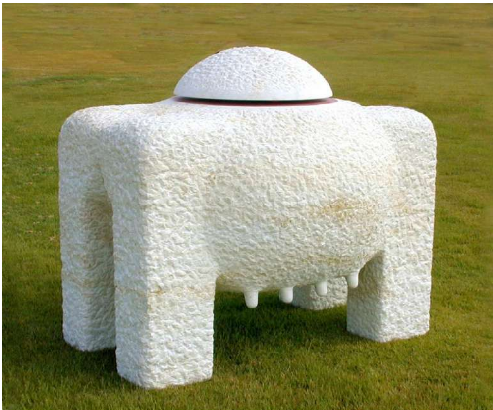
Origin Material : stone, paint, 120 x 140 x 110 cm Green Gallery, Israel

"מקור". מאתה תערוכה. פיסת האבן הזו מאחדת דימויים של מקדש, מזבח, עריסה ורקיע השמים. מקורם של כולם בבטן הגדולה של היוצרת, אמא טבע. המזרח התיכון, ערש שלוש דתות חשובות והמקום הקדוש ביותר לתרבויות רבות, מטפח ערכים רוחניים המשותפים לכל האנושות.