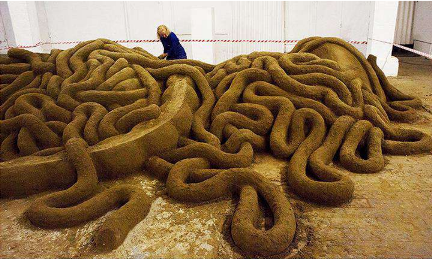
Tanya Preminger, Project "Harakiri", 2015, earth, 90 x 760 x 550 cm. 6th Moscow Biennale of Contemporary Art, "Fabrika", Moskow, Russia

פרוייקט מיוחד: "מרכז הנקודה נמצא בצד". טניה השתתפה עם עבודה מאדמה בשם "חראקירי".