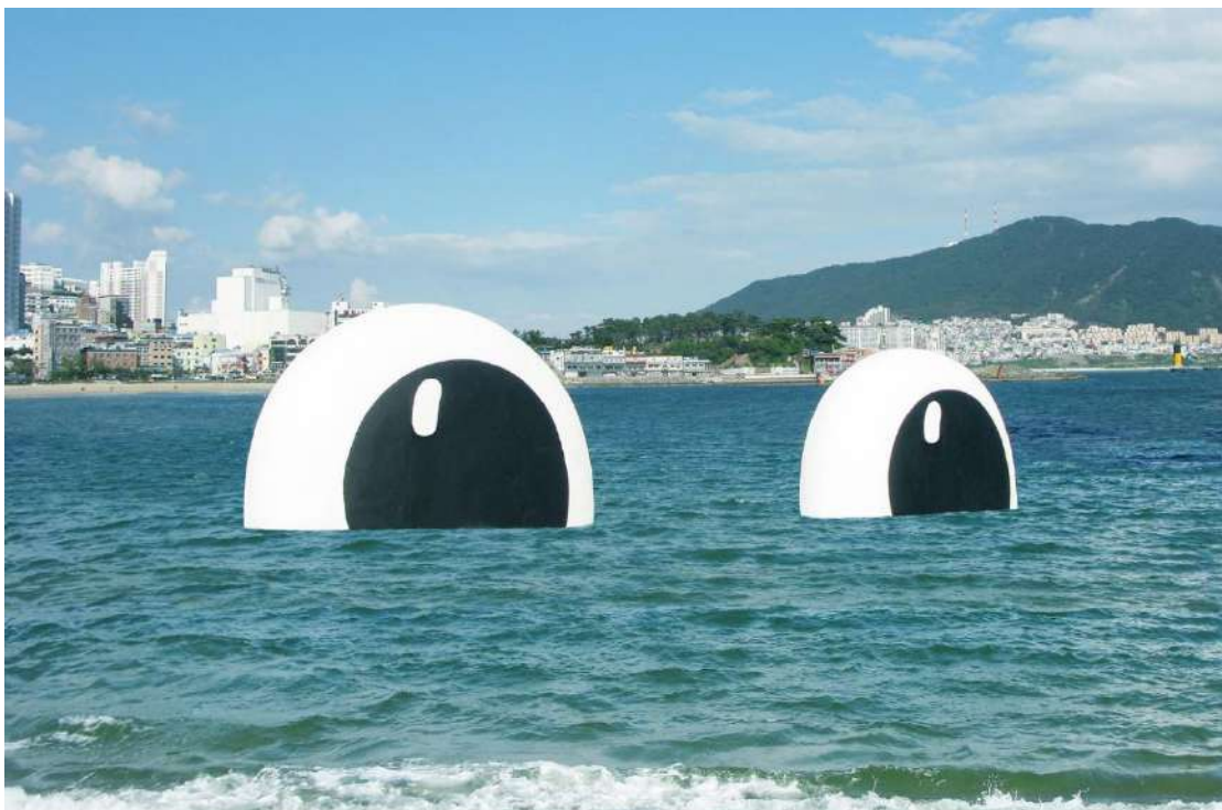
Tanya Preminger "Eyes of the Ocean". 2011, Sea Art Festival. Busan, Korea The sea is a live entity, with ability to feel and connect to the human spirit.

שם העבודה: "עיניי האוקיינוס". קונספט: הים הוא יישות חיה המסוגלת להרגיש ולתקשר עם רוח האדם.