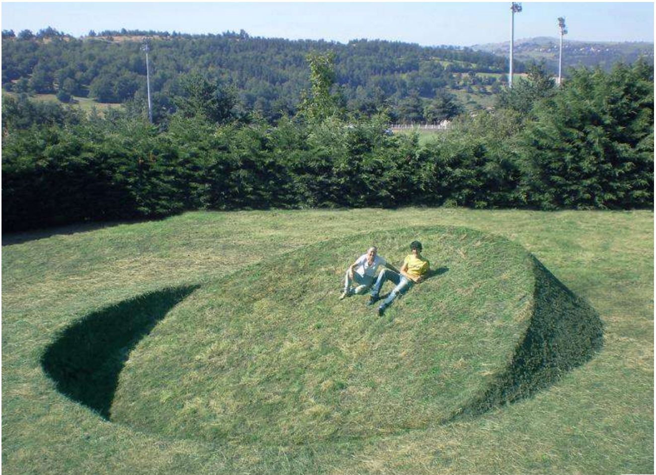
Tanya Preminger "Round Balance". 2008. Soil, grass. 900 x 900 x 260 cm. Art Festival Saint-Flour, France.

שם העבודה: "איזון עגול". המארגנים הזמינו במיוחד רפליקה של הפסל המקורי בגבעת ברנר. בווריאציה זו טניה יצרה חתך עגול ולא אליפטי כמו במקור כדי להפוך את הרעיון ליותר גלובלי. העבודה הוצגה בכתבי עת רבים לאמנות.