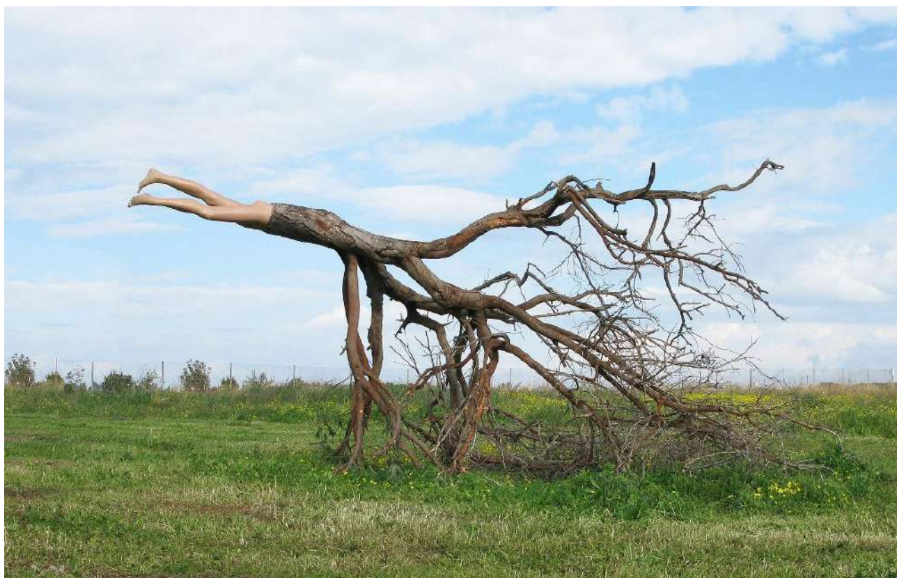
"And Time to Displace", 2009 Tree, plastic mannequin 250x400x230 cm, GreenGallery, Israel

מאותה התערוכה: "ועת לעקור". 2009. הגלריה הירוקה, ארסוף קדם, ישראל.