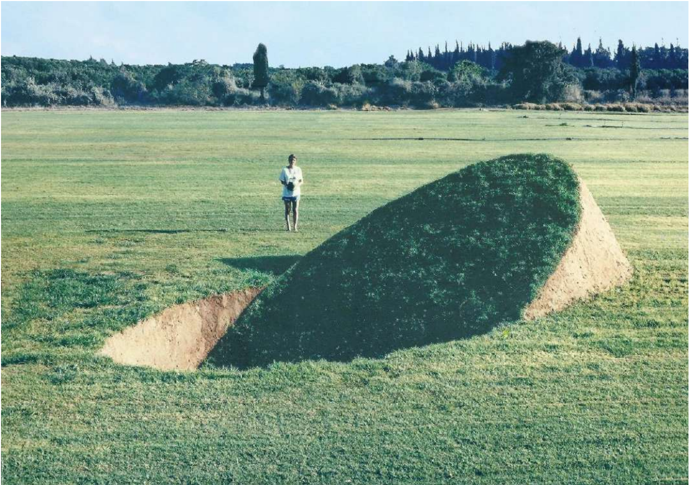
Tanya Preminger "Balance". 1989. Soil, grass. 350 x 900 x 440 cm. Solo exhibition. Givat-Brener, Israel.

תערוכת פיסול באדמה הראשונה בישראל בשדות קיבוץ גבעת ברנר. טניה הציגה 7 פרויקטים גדולים מאדמה ודשא על שטח של 50 דונם. אחד מהפרויקטים מהתערוכה Balance התפרסם, הפך לכרטיס הביקור שלה בעולם ופתח את דרכה לחו"ל. תמונות של הפרויקט מתפרסמות בקטלוגים רבים של אמנות נוף.