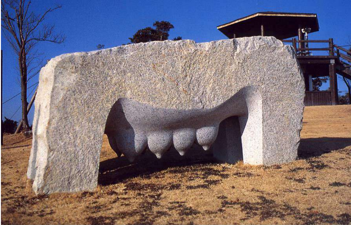
Tanya Preminger "Stone Mother". 1999. Granite. 90 x 200 x 90 cm. Nichiharima, Japan.

שם העבודה: "אם מאבן". אחת העבודות מסידרת "מאמא נוסטרה" שמפוזרות במקומות שונים בעולם.