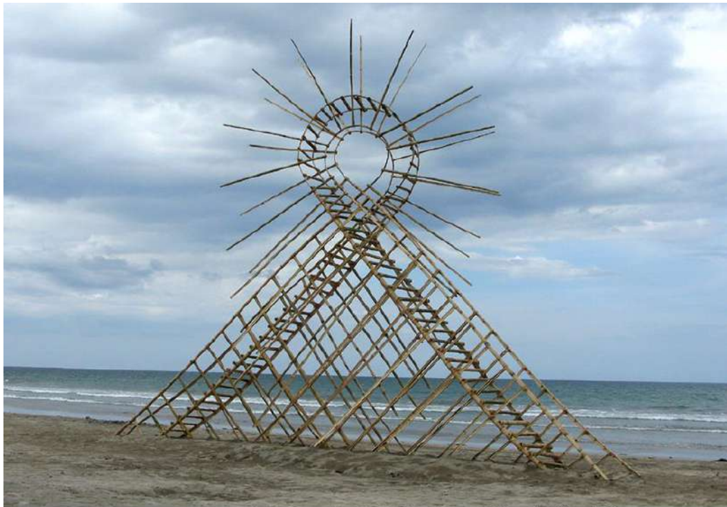
Tanya Preminger "Air Loop", 2010. Bamboo. 750 x 1300 x 200 cm. 3rd Bagasbas Beach International Eco Arts Festival, The Philippines.

שם העבודה: "לולאה באויר". רעיון: שתי הצדדים של "הלולאה" הגיעו מכיוונים מנוגדים, אך נפגשים באמצע ומתחברים למעגל - צורה הרמונית המייצגת את השלום, חיים, אושר- ערכים רוחניים.