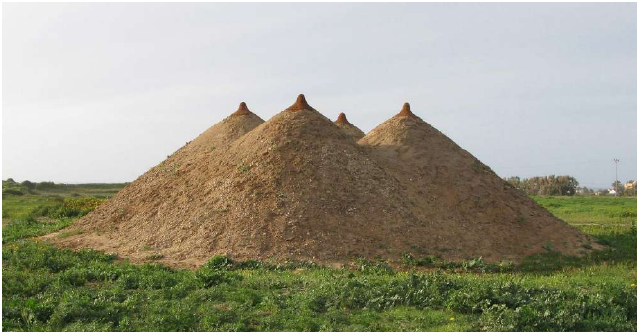
"Pyramid" 2009, earth, grass, 400 x 1200 x 1200, Arsuf, Israel

תערוכה קבוצתית בינלאומית בגלריה הירוקה אותה הקימה טניה. טניה הינה האוצרת, וכן אמנית משתתפת. הפסל "פירמידה", העשוי מאדמה מציג ארבעה שדיים הפונים כלפי מעלה - כתשובה למתנת החיים הניתנה לנו ע"י בוראת העולם.