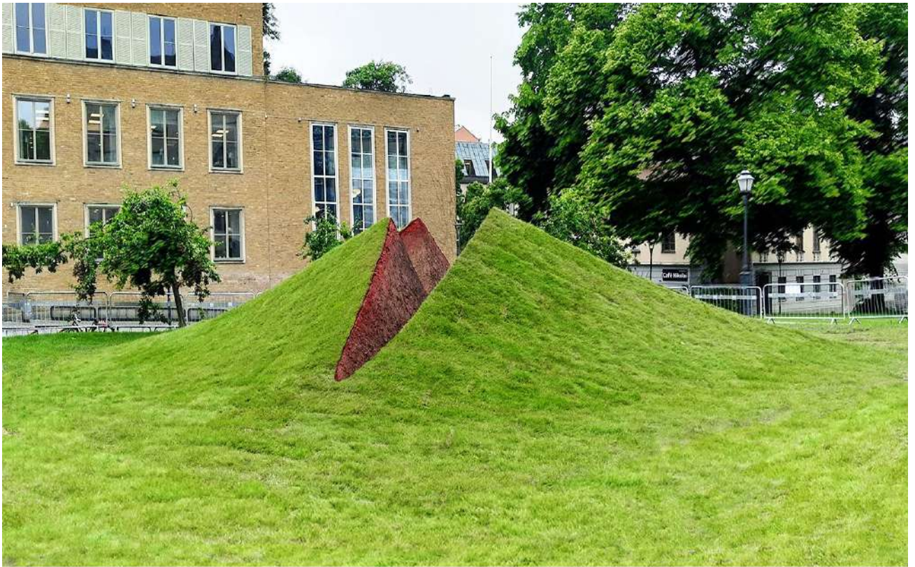
"Towards the Sky", 2022 Soil, grass, 260 x 1200 x 1200cm. Biennale of OPENART Örebro, Sweden.

התערוכה הכי גדולה בסקנדינביה, בהשתתפות 86 אמנים ממדינות שונים. שם העבודה: "כלפי השמיים". הצמחייה היא הפרווה של כדור הארץ, והאדמה היא הבשר של כדור הארץ. גוף כדור הארץ יכול לחוש וליצור קשר עם אלמנטים אחרים של היקום. בפרויקט "כלפי השמיים" כובב הלכת פותח את עצמו לכיוון השמים.