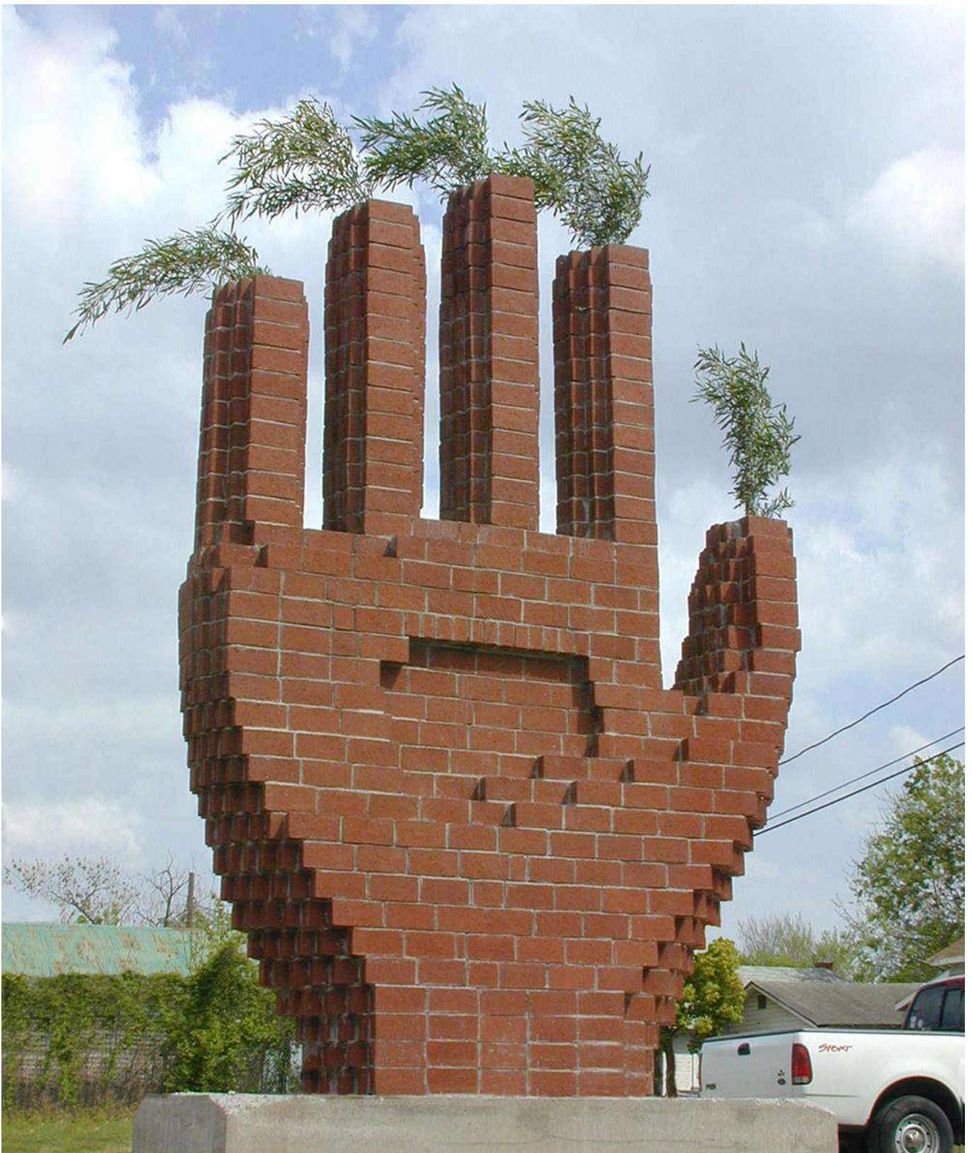
“Salute”, 2002 Bricks, concrete, iron, trees, 400 x 260 x 70 cm. Houston, USA.

פרוייקט חוצות עירוני בעיר יוסטון. טניה זכתה ברזידנס ובזכות להעמיד את הרעיון שלה כפרוייקט עם הסטודנטים.