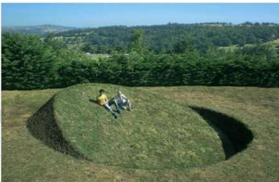
"Round Balance" (2008), soil, grass 900 x 900 x 260 centimeters, Saint-Flour, France.

Take a seat on one of Tanya Preminger's grass-covered artworks, and you won't be able to right the balance. The Israel-based artist created immovable slants and indentations embedded in the land that seem like they should tip depending upon the amount of weight settled on either side. For each sloping piece, Preminger employed an