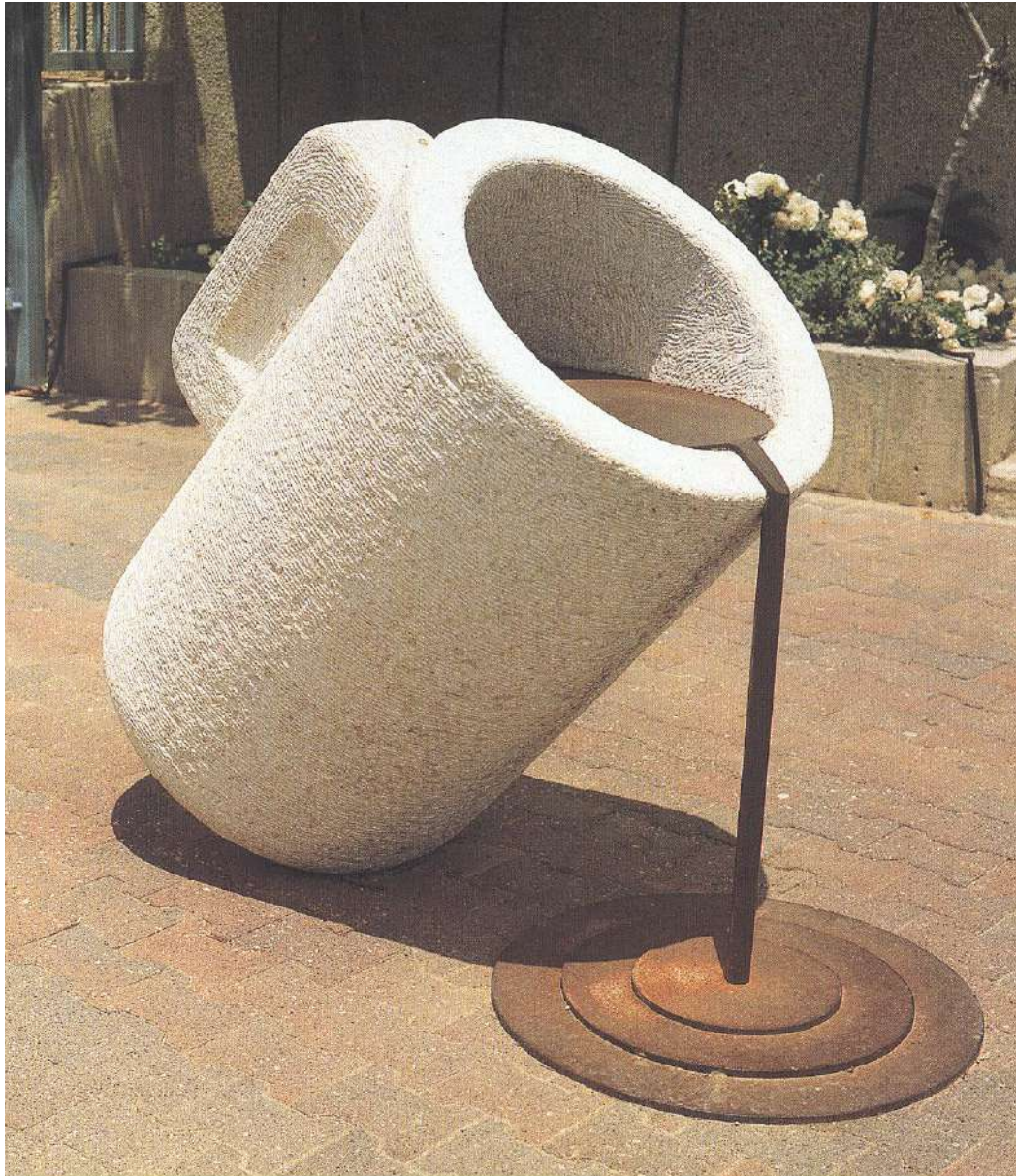
"Simple Relations", 1992, Stone, iron 150 x 110 x 70 cm, Tefen Museum, Israel

התערוכה הוצגה בגלריה "ארסוף" מכיוון שרק גלריה פתוחה במימדים כאלה יכלה לקלוט 6 עבודות מונומנטליות מאבן. העבודה "יחסים פשוטים" מהתערוכה, נקנתה ע"י האוצר עמוס קינן עבור מוזיאון תפן, ועמדה בכניסה למוזיאון עד סגירתו.