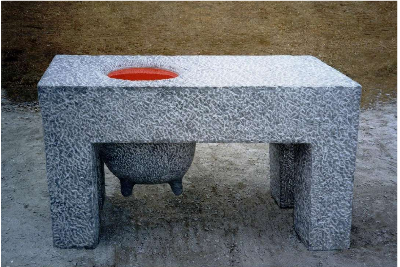
"Super Woman", 1995, Marble, painted aluminum, 90 x 160 x 75 cm, Stone Museum, Hualien, Taiwan.

טניה זכתה בפרס ראשון בתחרות והעבודה נשארה בקולקציית מוזיאון פיסול האבן בחואלין. שם העבודה "סופר וומן" הוא תרגום של שם סיני נשי.