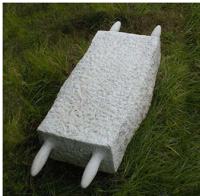
"Burden", 1998 Stone 30 x 140 x 55 cm Israel

מאותה התערוכה: "עול". (גדעון אפרת כתב מאמר לקטלוג התערוכה. ראו בפרק "ביקורת")