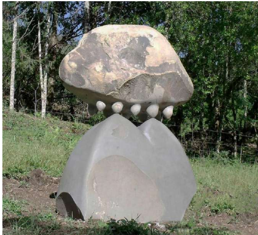
"Landscape", 2013, Basalt, 200 x 170 x 90 cm, Sculpture Park, Bento Gonçalves, Brasil

שם העבודה: "נוף". העבודה זכתה במקום ראשון בתחרות.